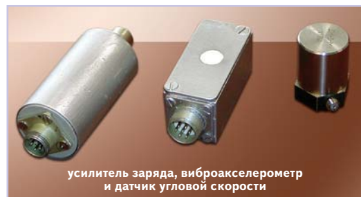
усилитель заряда, виброакселерометр и датчик угловой скорости

Разработка "серьезного" программного обеспечения в рамках рассмотренного проекта не была предусмотрена. Поэтому программная поддержка системы регистрации ограничена комплектом демонстрационных и тестовых программ, включающих программу для работы под Windows, обеспечивающую просмотр всех полученных данных, программу для работы под DOS, обеспечивающую просмотр небольшого начального участка массива зафиксированных данных и позволяющую сформировать файл задания всех необходимых