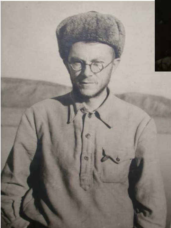
Это я, мне 35 лет*