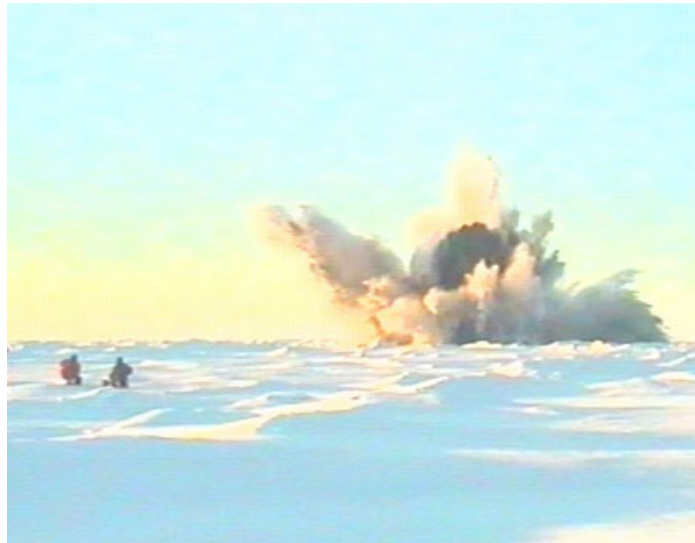
Рис.5 Отработка пункта взрыва

спрятался, я не виноват” и включает машинку. Через доли секунды ощущаем резкий удар по ступням, затем 1-2 более слабых (пульсации газового пузыря), и вот султан воды и обломков льда вздымается над поверхностью (рис.5).