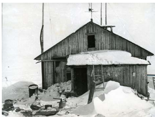
Станция «Утес Деревянных Гор». 1975 год.