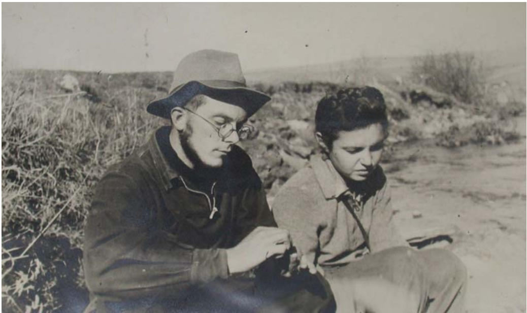
Забайкалье, на производственной практике, 1948 год