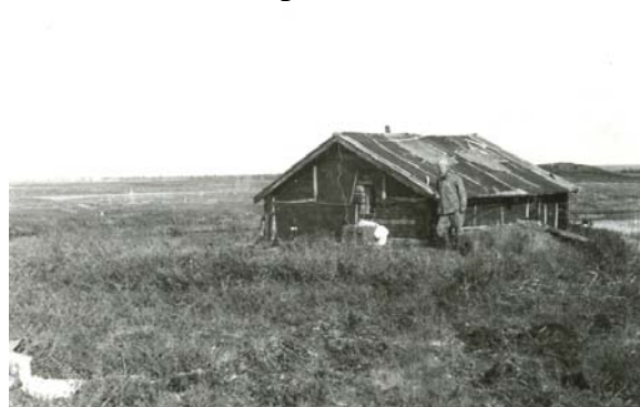
Станция «Уджа». 1976 год.