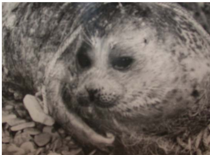
Тюлененок, “спасенный” Натальей Иосифовной

Мы пешком по берегу, они вплавь вдоль берега!!! Дружба!