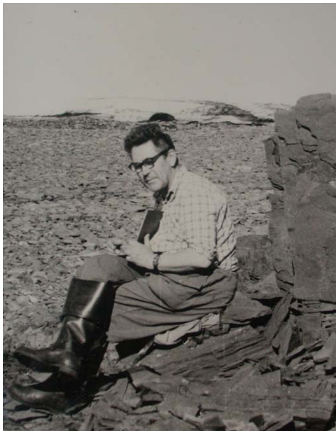
И в Арктике бывает тепло – Новая Земля, В.И. Устрицкий (1979 г.)