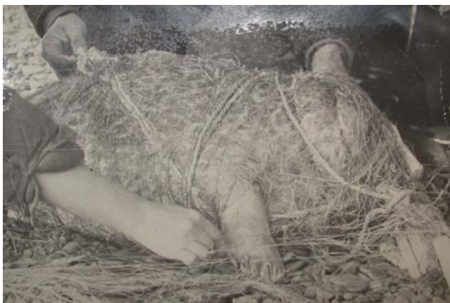
Тюлененок в плену

Попытались сразу распустить сеть в воде, но не получилось. А главное - очень агрессивно себя вела большая тюлениха, видимо, мамаша попавшего в беду тюлененка! Она кругами ходила вокруг нашей небольшой (2-3-х местной) резиновой лодки, с каждым разом уменьшая радиус круга, приближаясь к лодке. Было ясно, что если она протаранит лодку или, подпихнув ее снизу, перевернет, то нам будет худо - вода холодная, глубокая, а ведь мы были в полном снаряжении, особенно опасно упасть в воду в резиновых сапогах с высокими голенищами, которые, как якорь, потянут человека на дно. Мы начали быстро, насколько позволяла тянувшаяся сзади сеть с тюлененком, грести к берегу. Тюлениха же крутила вокруг лодки до тех пор, пока мы не достигли мелководья, лишь у самого берега оставив нас в покое.