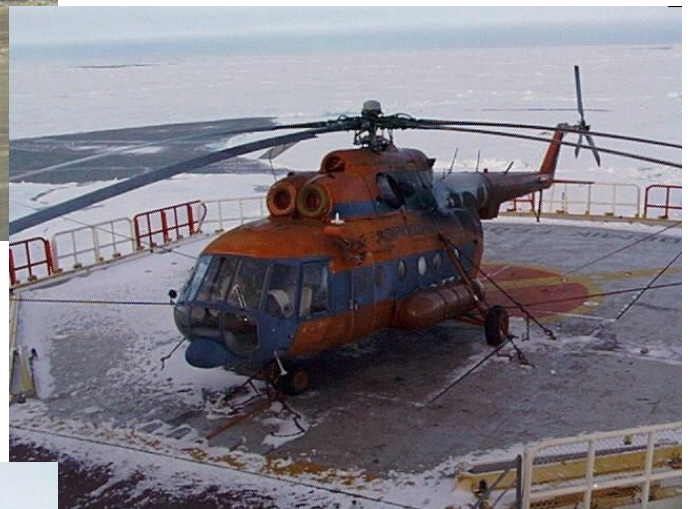
Рис.3 МИ-8 взлетает с вертолетной площадки НЭС “Академик Федоров”