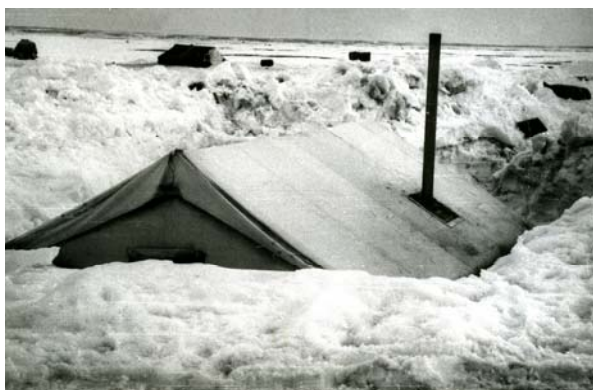
Станция «Темп». 1973 год.