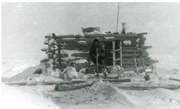
Станция «Мыс Хвойнова». 1976 год.