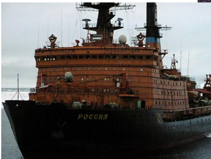
Рис.4 Атомный ледокол “Россия”