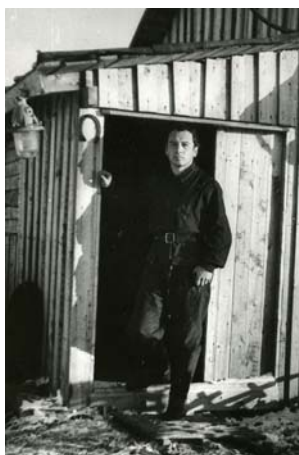
Станция «Баренцбург». 1977 год.