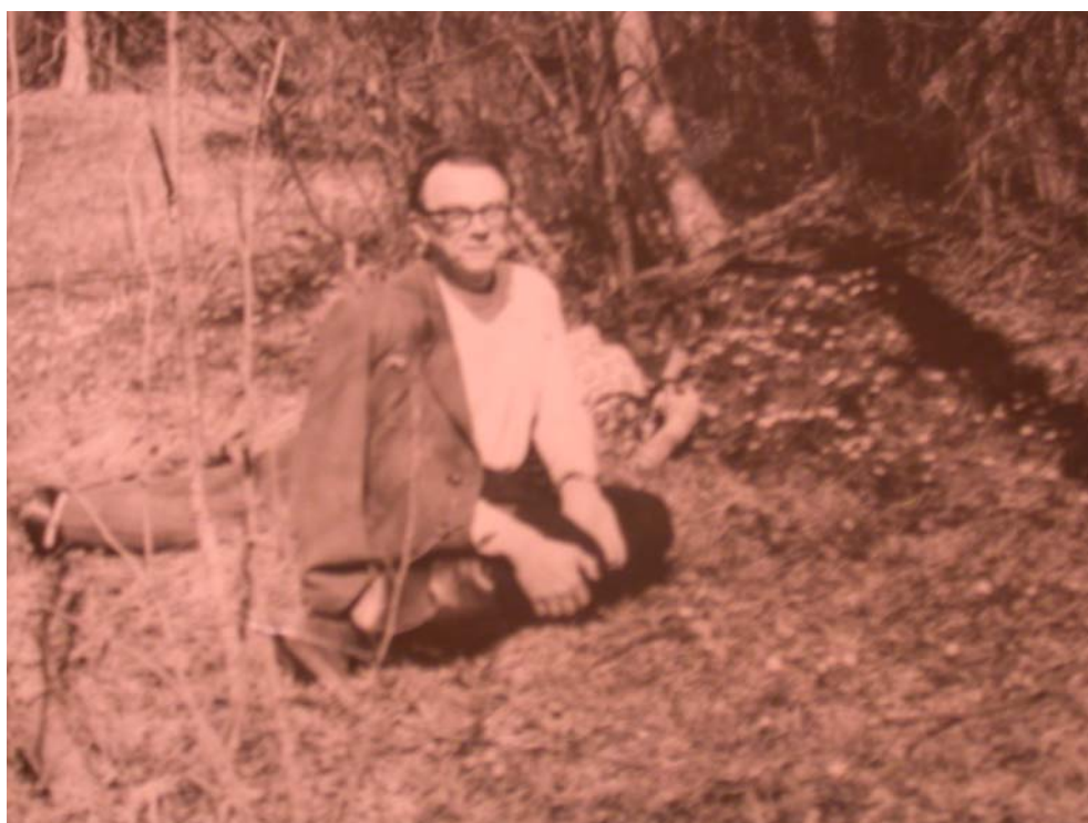
И.С. Грамберг – Валдайский лес