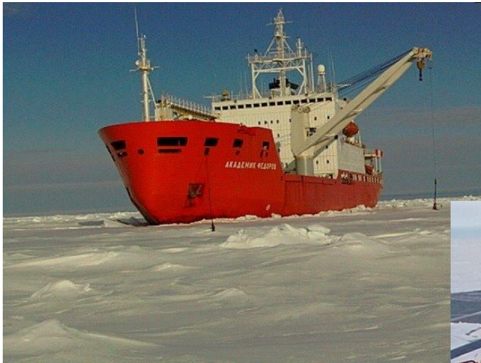
Рис.2 Научно-экспедиционное судно “Академик Федоров”

Помимо главного вида, работ ГСЗ, комплекс наблюдений включал в себя широкий круг геолого-геофизических, гидрологических, экологических и др. исследований. Сейсморазведчики должны были добыть информацию о глубинном геологическом строении региона.