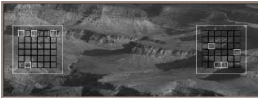
Рис. 1 – Выбор ориентиров местности

После нахождения параметров стабилизации компенсация неуправляемых перемещений и крена поля зрения производится по формулам (1)-(2).