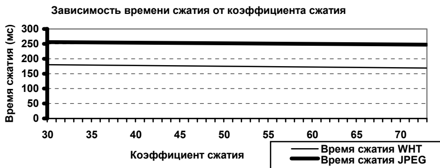
Рис. 3. График зависимостей времени сжатия от коэффициента сжатия для разработанного алгоритма и стандартного алгоритма JPEG