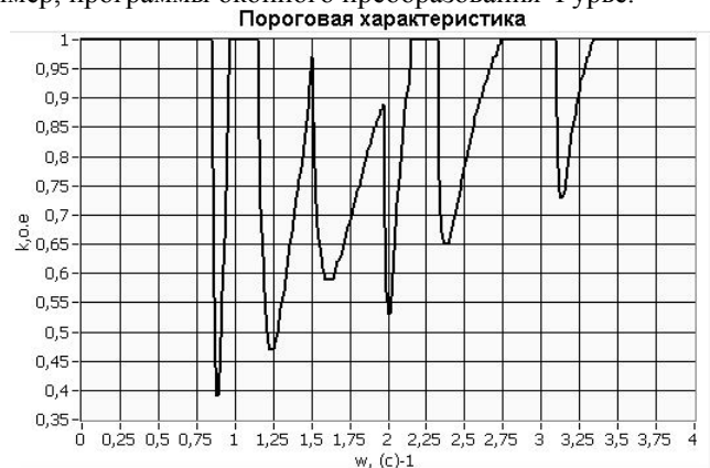
Рис.2 Пороговая характеристика колебаний

Разработанная программа существенно проще других программ, предназначенных для решения аналогичных задач, например, программы оконного преобразования Фурье.