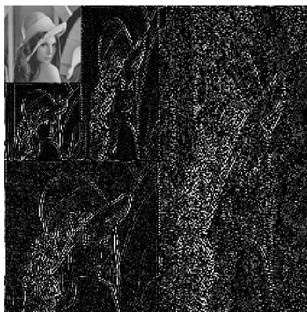
Рис. 3: Пример вейвлет-декомпозиции с использованием неразделимых фильтров, выполненная по разработанной методике.

В ходе работы описанный принцип фильтрации был реализован в среде MatLab. Фильтр преобразуется в специальной процедуре, то есть разработчик фильтров избавлен от перегруппировки коэффициентов. На полученном разложении алгоритм SPIHT строит свою работу аналогично разделимому варианту используя подобие высокочастотных субполос. Такой подход позволил не только применять SPIHT, но и дал еще целый ряд преимуществ: сделал более доступным не нулевое расширение сигнала при фильтрации (например, периодическое, реализация которого на ромбических структурах технически сложная задача); позволил существенно снизить объем требуемой памяти; упростил визуализацию и обработку вейвлет-разложения.